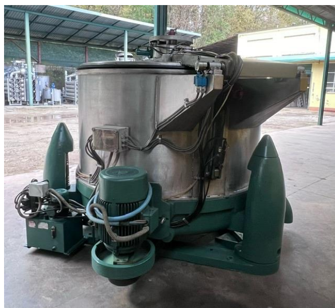
2- Extrator centrífugo.