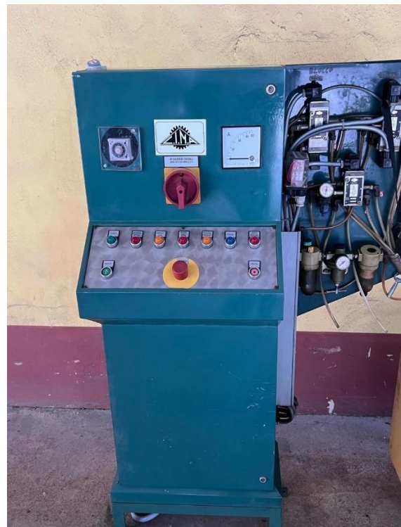
3- Painei de controle do extrator centrífugo.