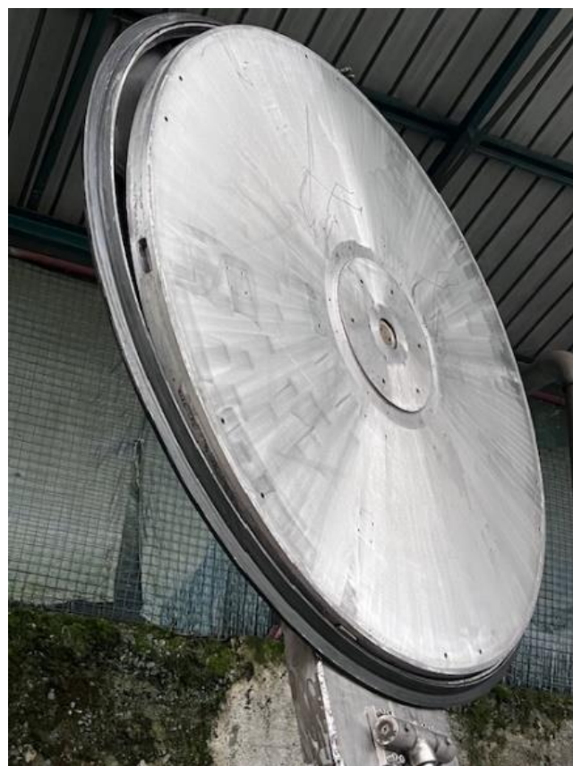
4- Cesto e tampa do extrator centrífugo.